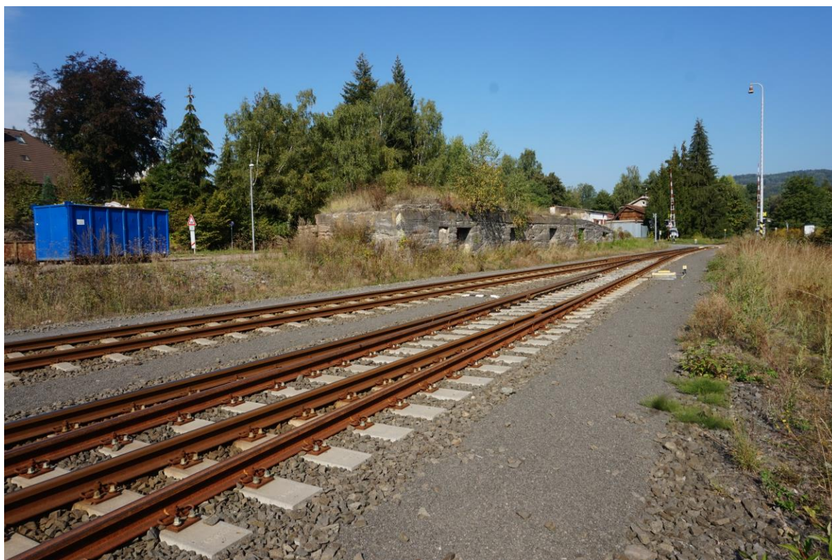
Obr. 3: Severní část žst. Semily (16. 9. 2020)

Dne 11. 1. 2021 byla vydána formou rozhodnutí Krajského úřadu Libereckého kraje (Sp. zn. KULK 1590/2021) výjimka z ochranných podmínek zvláště chráněných druhů živočichů pro druh ještěrka obecná ( Lacerta agilis ), a to konkrétně ze zákazu je rušit, měnit a ničit jejich dochovaná sídla. Výjimka má platnost do 31. 12. 2025. Její kompletní znění je součástí dokumentace (viz H.6. Stanoviska).